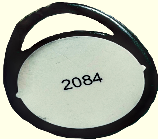
Nøkkelbrikke til søppelanlegget

Husk at ved strømbrydd fungerer ikke chippen til inngangsdøra, så ta godt vare på nøklen!